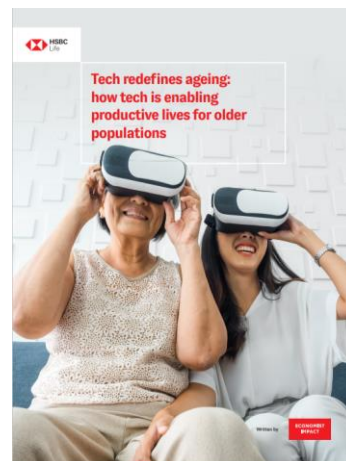
图 3：香港汇丰保险开展了一项思想领导力调查，重点关注科技如何帮助长者过上高效的生活。