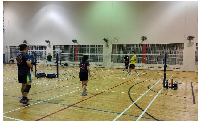
图 7：为了支持员工的健康，新加坡的同事参加了每周的羽毛球课程。