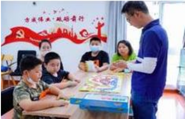
图 5：中国大陆的儿童通过理财素养棋盘游戏学习了基本的金融知识。