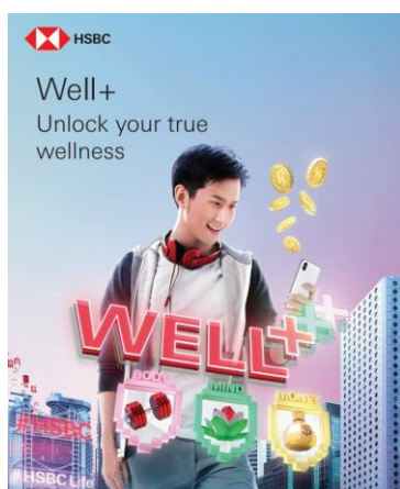
图 1：香港汇丰保险于 2022 年推出一个名为“Well+”的在线健康平台。