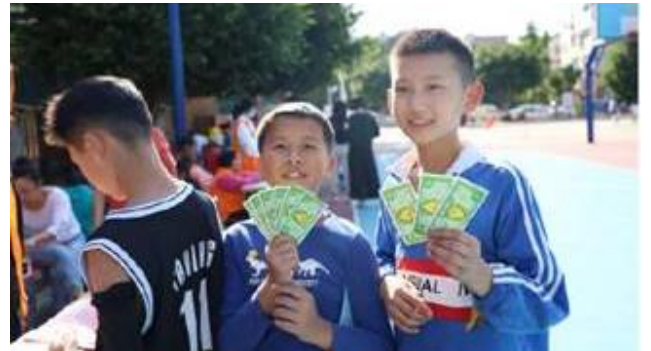
图 4：中国内地的儿童在“汇保万家-社区儿童财富成长计划”中学习了基本理财知识。