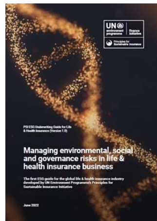
图 8：首份《ESG 人寿和医疗保险承保指南》由 UNEP FI 可持续保险原则 (PSI) 发布，由汇丰保险于 2022 年 6 月联合赞助和联合牵头。

2022 年 6 月，PSI 在汇丰保险的联合赞助和牵头下发布了第一份《ESG 人寿和医疗保险承保指南》。本指南为人寿和医疗保险公司提供了一个框架，用于在承保期间评估一系列 ESG 风险以及与死亡率、患病率、寿命和住院风险相关的因素，并包括风险缓解策略和最佳实践示例供保险公司考虑。这项工作涉及一个由汇丰保险领导的全球项目团队，该团队汇集了来自其他 11 家 PSI 成员公司的可持续发展专家，最终巩固了保险公司在协助解决我们时代的重大 ESG 挑战（如传染病的传播）方面所需发挥的关键作用。生物多样性和自然损失、社会不平等以及心理健康和福祉。